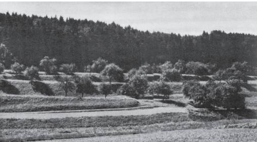
Ackerterrassen bei Wellhausen um 1960...

Die Stiftung Landschaftsschutz Schweiz erarbeitete in den Jahren 2009 und 2010 im Auftrag der Abteilung Natur und Landschaft des Amtes für Raumplanung ein Inventar der Ackerterrassen für den gesamten Kanton Thurgau. Ziel der Inventararbeiten war es, eine Übersicht über die Ackerterrassen im Kanton zu gewinnen und den Erhaltungsgrad, die Qualität der Ackerterrassen, sowie den Handlungsbedarf zu beschreiben. Mit dem nun vorliegenden Inventar konnte ein Arbeitsinstrument für die Raumplanung geschaffen werden, welches auch dazu beitragen kann, dass die vielerorts in Vergessenheit geratenen Ackerterrassen wieder ins Bewusstsein der Bevölkerung geraten.