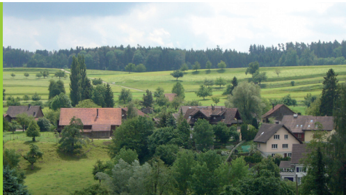
Terrassenfluren bei Buhwil und Riedt (Schlüsselgebiete 4 und 5)

Der Inventarisierung folgt also ein Umsetzungsprozess, welcher mit dem Aufzeigen des Handlungsbedarfs im Inventar in Gang gesetzt wurde. Der Umsetzungsprozess kann durch die Gemeinden sehr unterschiedlich gestaltet werden. Es bestehen zahlreiche Möglichkeiten, die neben dem normativen Schutz und der planerischen Sicherung, von Bewirtschaftungslenkung bis zu Unterhaltsförderung reichen können.