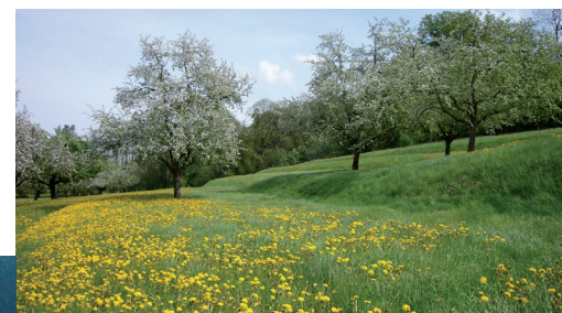
Terrassenflur bei Märstetten

Die Mehrheit der Terrassenstandorte im Kanton Thurgau wird hauptsächlich als Wies- oder Weideland genutzt. Im Wiesland sind die Terrassenböschungen meist gut erhalten, gefährdet werden sie hier vor allem durch den Einsatz von Maschinen. Die Beweidung wirkt sich bei hoher Intensität negativ auf den Erhaltungsgrad der Terrassen aus.